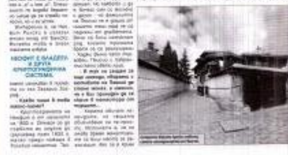
Снимка на историческа сграда в Банско.